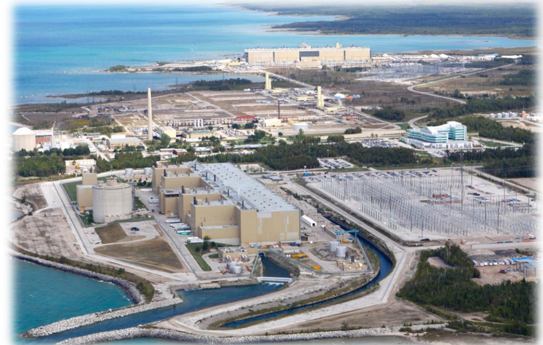
Site de Bruce Power

On ne peut discuter des tubes de force, des demandes d'exemption de l'accréditation d'anciens opérateurs de réacteur d'OPG ni du projet de système de production d'isotopes (lutécium 177), puisque ces questions sont devant la Commission.