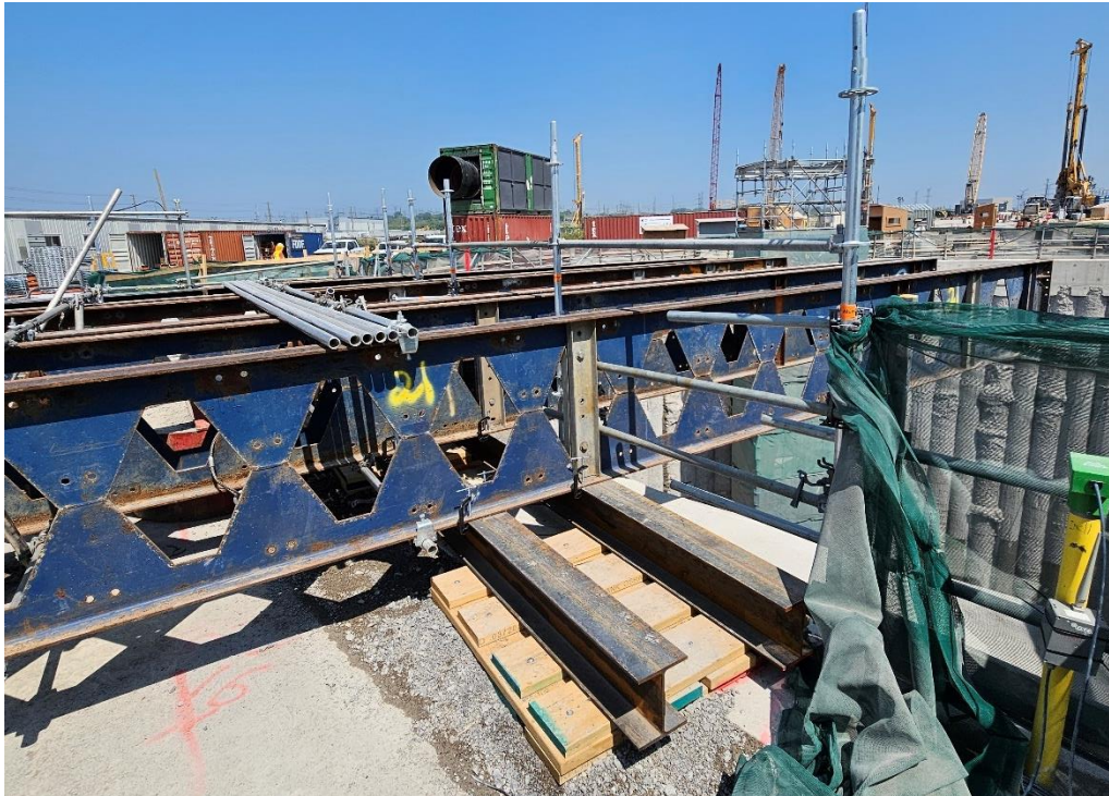
Figure 1 : Poutres en I en saillie au-dessus du puits de lancement du tunnelier

RIE : Accidents de travail sur le site du projet de nouvelle centrale nucléaire de Darlington d'Ontario Power Generation